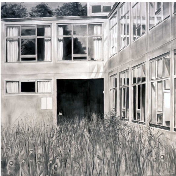
Yves B elorgey, Hochschule f ur Gestaltung, Ulm(9) , janvier 2011. Graphite sur papier, 240 x 240 cm (format image), 250 x 270 cm (format papier).