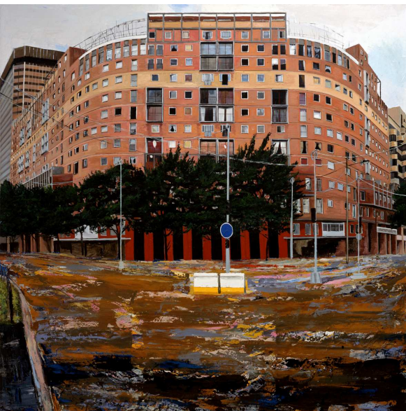
Yves Bélogey, Immeuble de la porte de Pantin , Architecte Paul Chémétov, Construction 1980, octobre 2010. Huile sur toile, 240 x 240 cm.