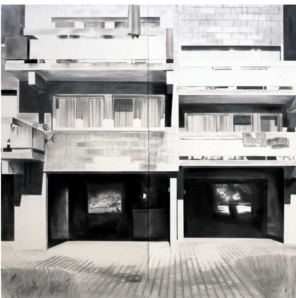
Yves B elorgey, Tannenhof Siedlung, Ulm(8) , mars 2011. Graphite sur papier, 240 x 240 cm (format image), 250 x 270 cm (format papier).