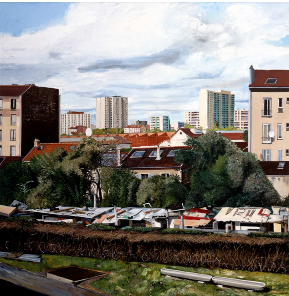
Yves Bélogey, Vue des entrepôts de la SERNAM à Pantin , octobre-novembre 2010. Huile sur toile, 240 x 240 cm.